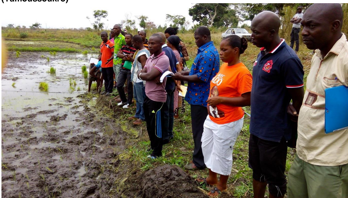
Les producteurs sur le site de formation pratique à Subiakro (Yamoussoukro)