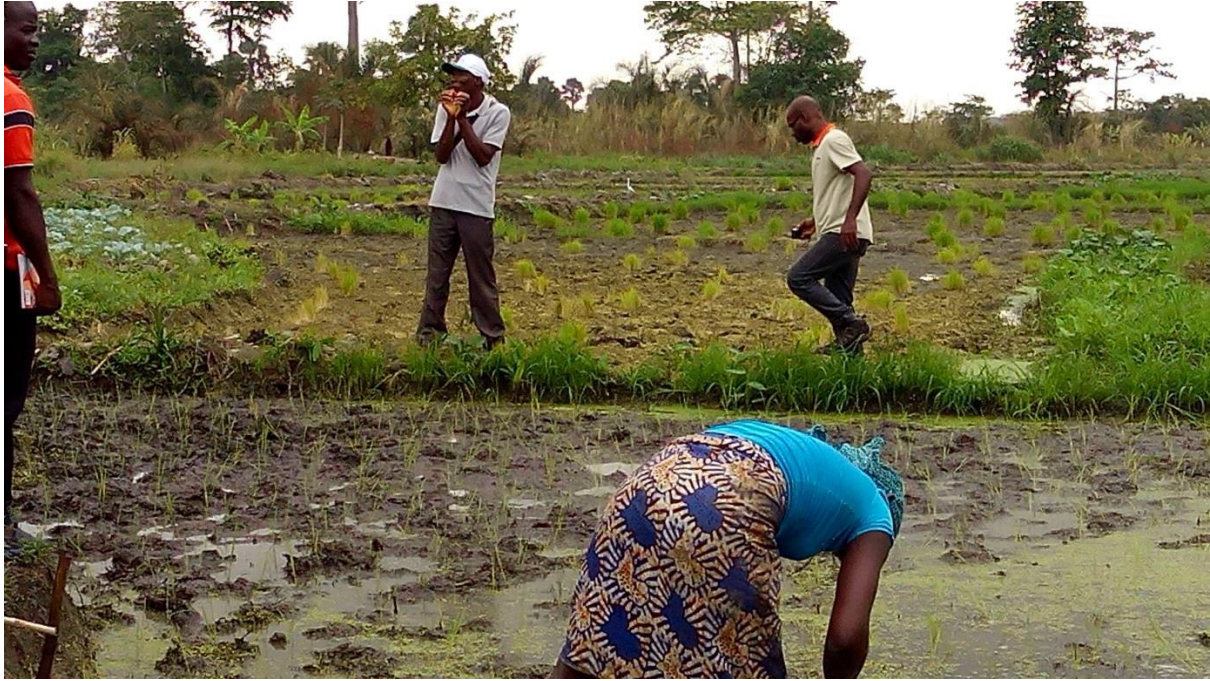
Une rizicultrice se familiarise au repiquage à un brin recommandé pour le SRI sur le site de Subiakro (Yamoussoukro)